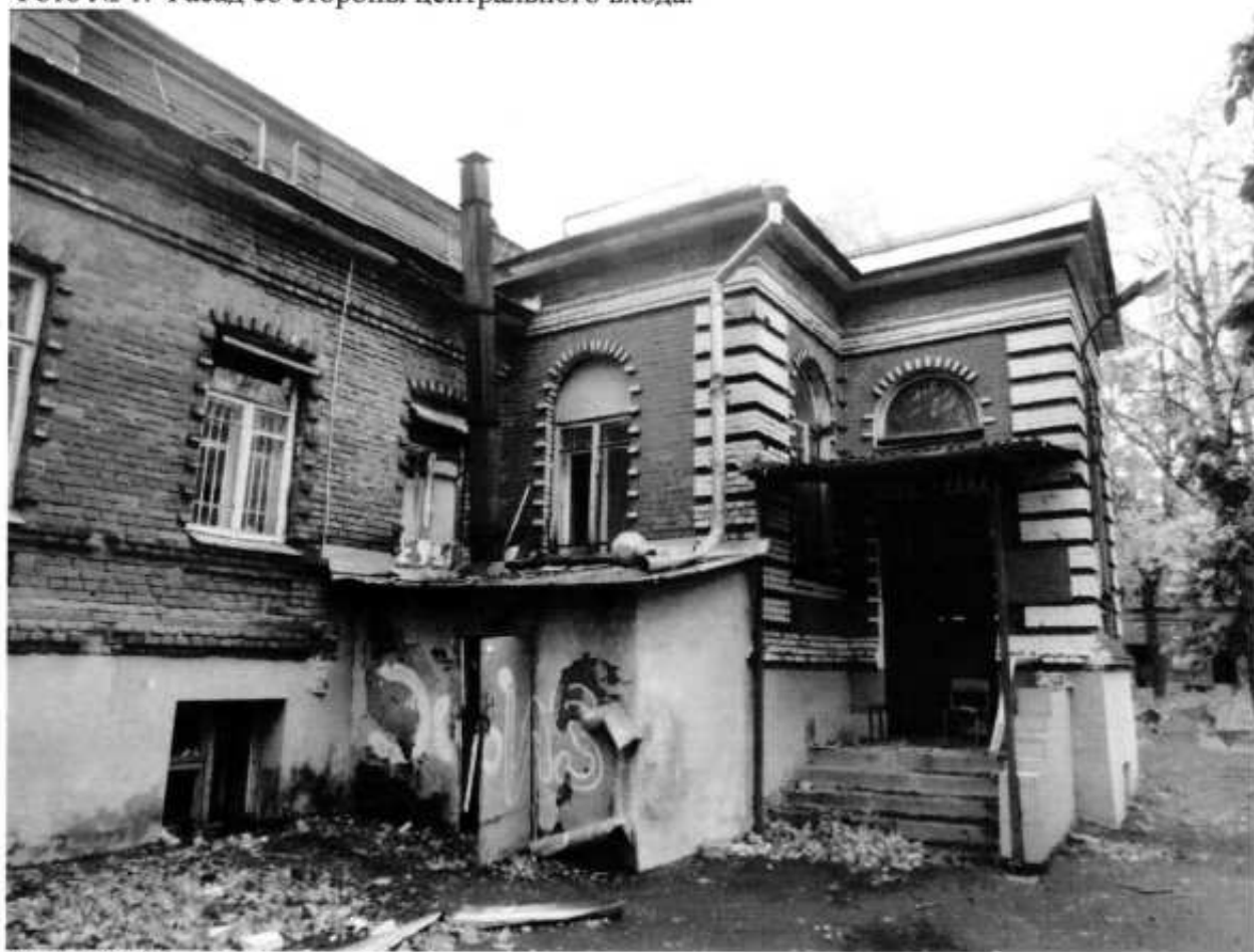
Фото № 2. Фасад со стороны центрального входа.