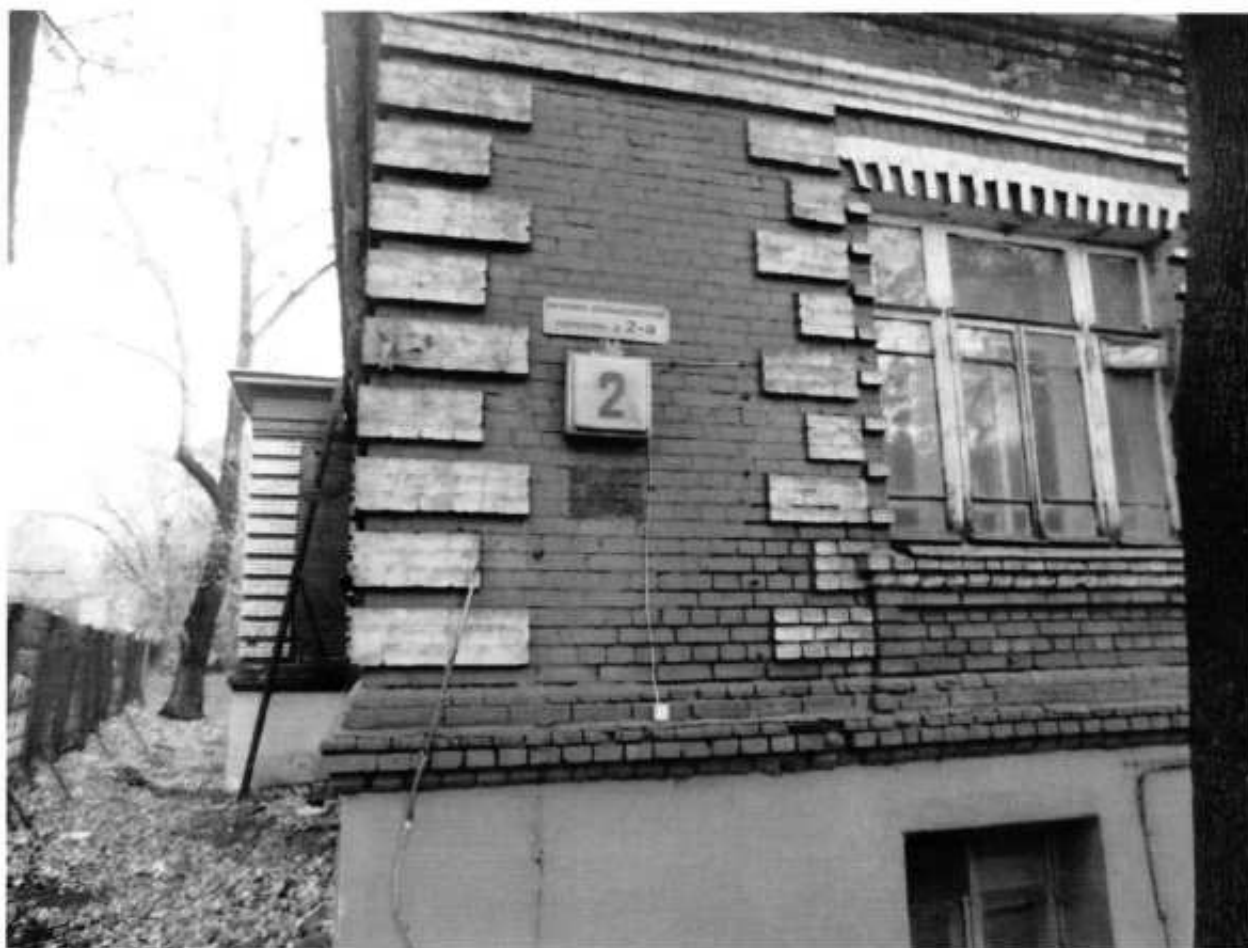
Фото № 3. Боковой фасад.