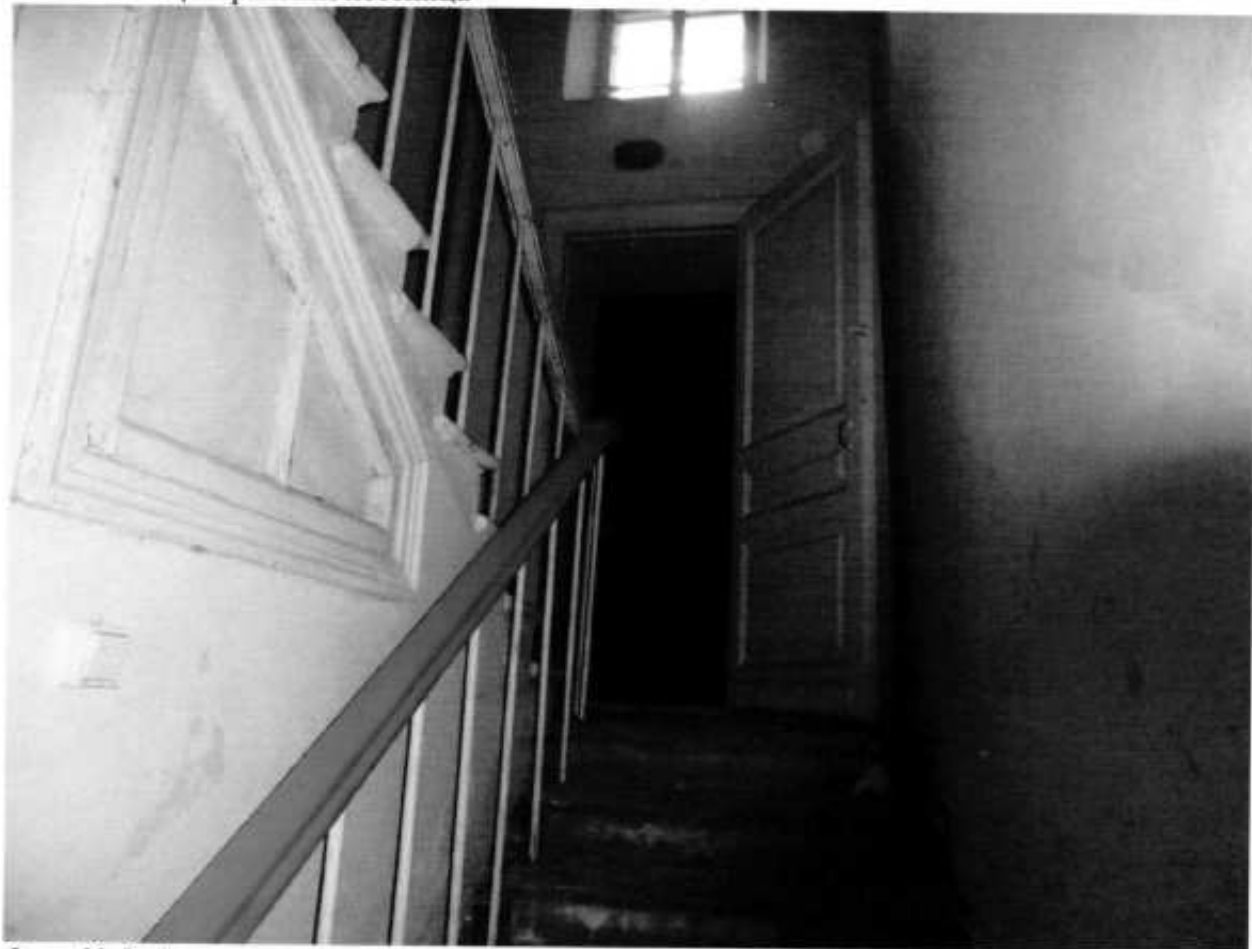
Фото № 8. Лестница из полуподвала на первый этаж.