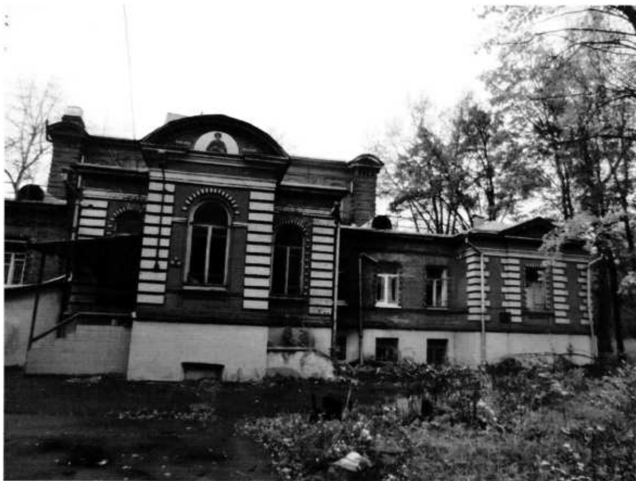
Фото № 1. Фасад со стороны центрального входа.