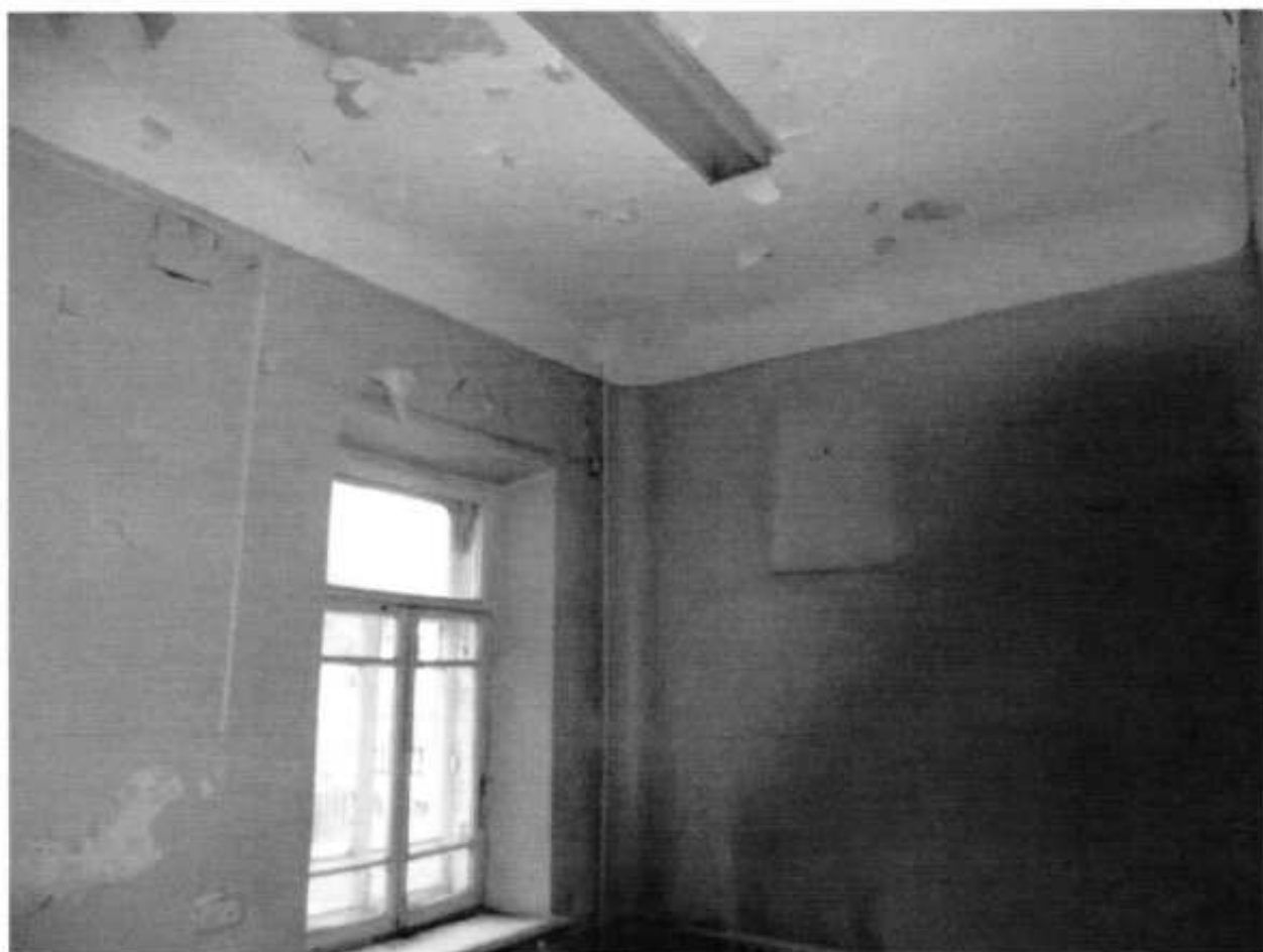
Фото № 9. Помещение 1 этажа.