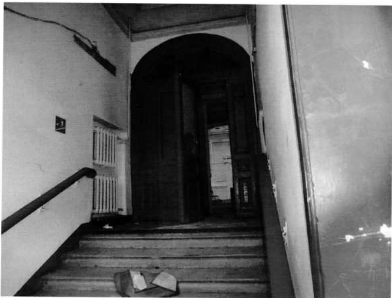
Фото № 7. Центральная лестница