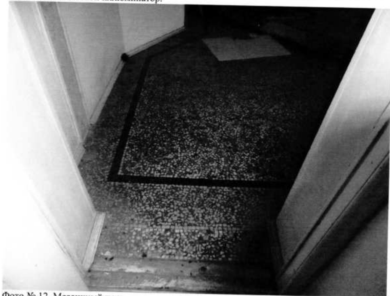
Фото № 12. Мозаичный пол.