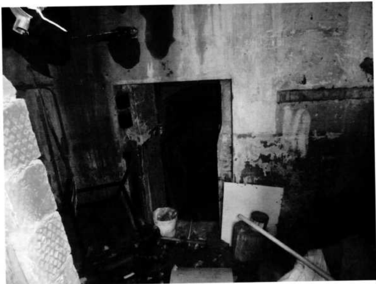
Фото № 5. Полуподвальное помещение.